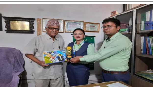
लुम्बिनी साकोस र एन.एम.वि. बैंक बीच मायाँको चिनो साटासाट तथा नयाँ वर्ष २०७९ को शुभकामना आदान प्रदान ।