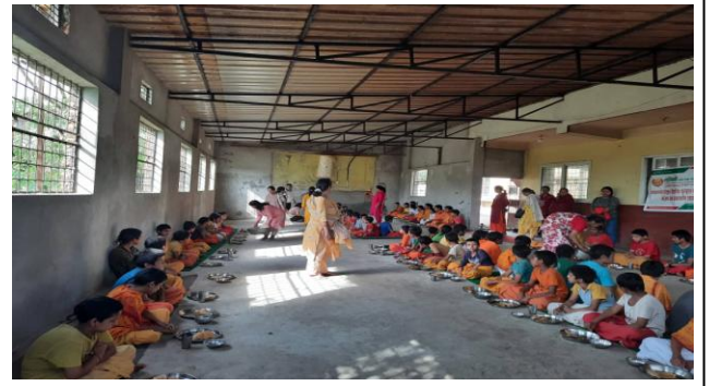
श्री मनकामना गुरुकुल विद्यापीठ नन्दनवनका विद्यार्थीहरुलाई भोजन सहयोग लुम्बिनी साकोस बाट ।