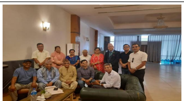
सहकारी विभागका आदरणीय रजिष्ट्रार, उप-रजिष्ट्रारका साथमा संचालक तथा लेखा समितिका सदस्यहरु ।