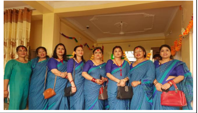
भलुही सेवा केन्द्र उद्घाटनमा लुम्बिनी साकोसको महिला समितिको उपस्थिती ।