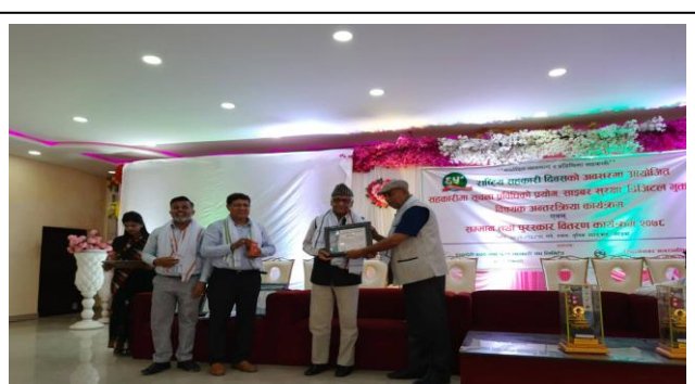
६५ औं राष्ट्रिय सहकारी दिवसमा यस सहकारीका अध्यक्ष तथा संस्था सम्मानित रुपन्देही बचत संघ बाट ।