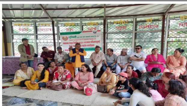
श्री मनकामना गुरुकुल विद्यापीठमा लुम्बिनी साकोस बाट अवलोकन ।