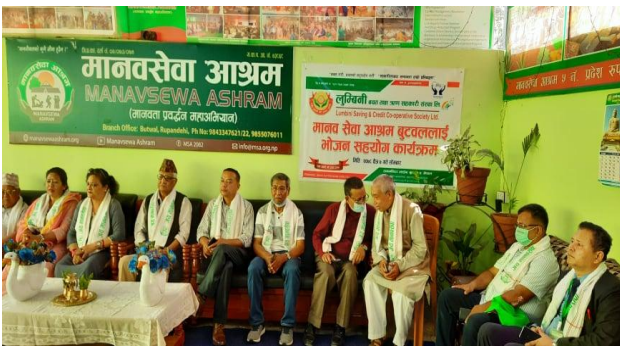
मानवसेवा आश्रम बुटवल लाई खाद्यान्न सहयोग कार्यक्रममा ।