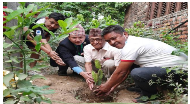
वृद्धाश्रम हातामा वृक्षारोपण ।