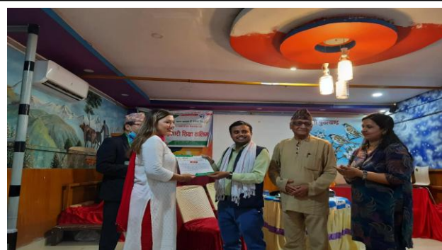
देवीनगर सेवा केन्द्रको आधारभूत सहकारी शिक्षा तालिममा सहभागी लाई प्रमाण-पत्र वितरण गर्दै ।