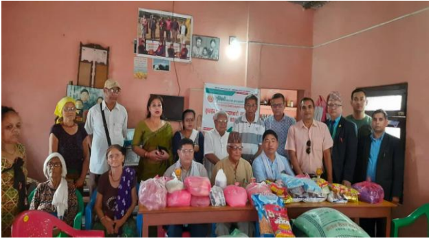
श्री कुष्ठ रोग प्रभावित कल्याणकारी संस्था जीतगढीलाई खाद्यान्न सामग्री हस्तान्तरण कार्यक्रम ।