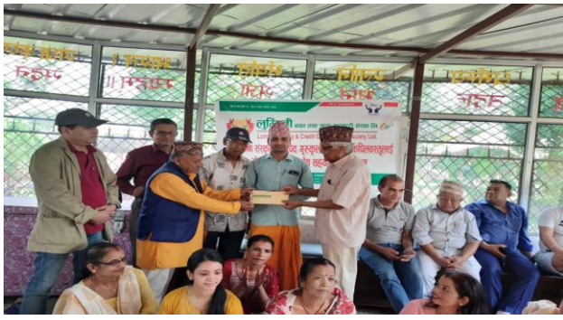
श्री मनकामना गुरुकुल विद्यापीठका अध्यक्ष लाई लुम्बिनी साकोसबाट अक्षयकोष रकम हस्तान्तरण ।