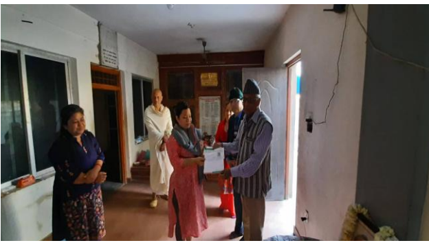
सदस्य राहत हस्तान्तरण कार्यक्रम ।