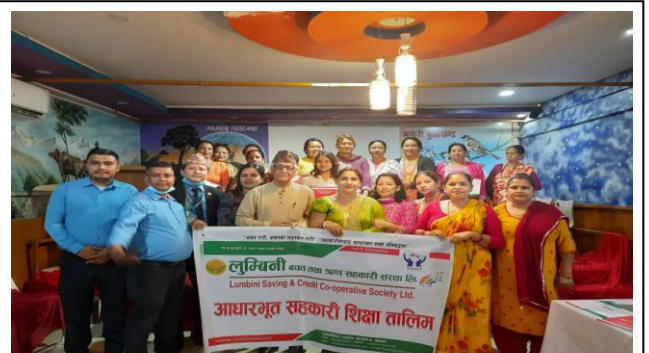
देवीनगर सेवा केन्द्रको आधारभूत सहकारी शिक्षा कार्यक्रममा सामूहिक फोटो ।